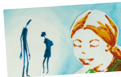
Journal Sébastien Laudenbach

Aujourd'hui n'existe plus. Vois les tunnels qu'on a pris, vois à quoi ressemble la sortie.