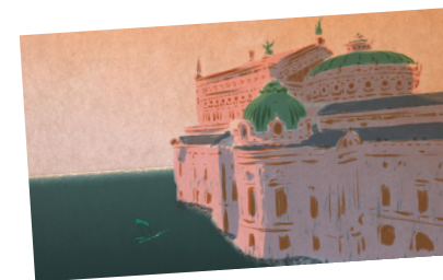
Vibrato Sébastien Laudenbach