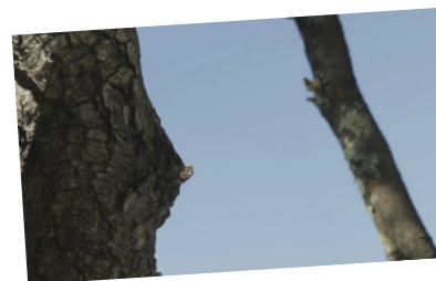
Daphné ou la belle plante Sébastien Laudenbach, Sylvain Derosne